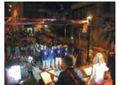
Moment de Festa Major 2013

Per la Festa Major continuem amb el canvi de dates que ja vam introduir l'any passat, així que aquest any es celebrarà els dies 11, 12 i 13 de juliol . També mantindrem el mateix format estructural que les dues edicions passades, on la plaça Joan Matons tornarà a ser el centre de la festa. De moment podem confirmar que el concert del divendres a la nit anirà a càrrec del Don Vito i los Corleole, on ens presentaran els temes del seu nou disc; també repetim el dissabte amb l'orquestra Taxman, farem la guerra d'aigua, la festa de l'escuma, la baixada de carros, la cursa de mountain-bike, les exposicions, ballaran les colles de gitanes de Martorelles, farem el teatre i l'activitat infantil a la font Sunyera, etc... i una activitat nova que no us la podem dir perquè és una sorpresa! Totes les activitats seran, com sempre, gratuïtes.