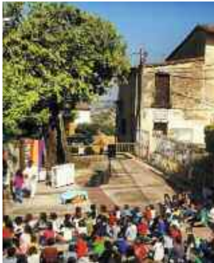
Obra de teatre "ploma de pingüí"

La regidoria d'Educació, el CEIP Les mimoses i l'AMPA, van organitzar el passat 23 d'abril, dia de Sant Jordi, un mercat d'intercanvi de llibres a la plaça de l'església. Al finalitzar l'activitat tots els participants van poder gaudir de l'obra de teatre "ploma de pingüí: l'important és que t'estimin" a càrrec de la