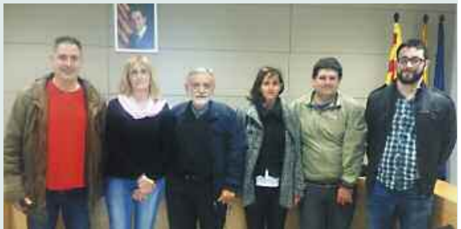
Representants de la mancomunitat de Santa Maria de Martorelles i Martorelles

El término de la ejecución de las obras es de siete meses, por lo que está previsto que se acaben antes de finalizar este año.