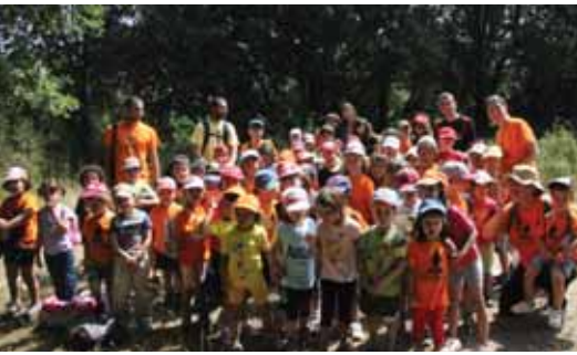
Nens del casal d'estiu

sistemática. Creemos que los niños ya han estado durante todo su curso escolar en el aula, y que un Casal debe ofrecer un espacio distinto, más libre y enriquecedor. Des de la ésta regidoria se ha planteado realizar una reunión de valoración del trabajo realizado este mes de julio, con todo el equipo que ha estado en nuestro pueblo. Queremos estar cerca del proyecto y su realización y seguir formando parte de él.