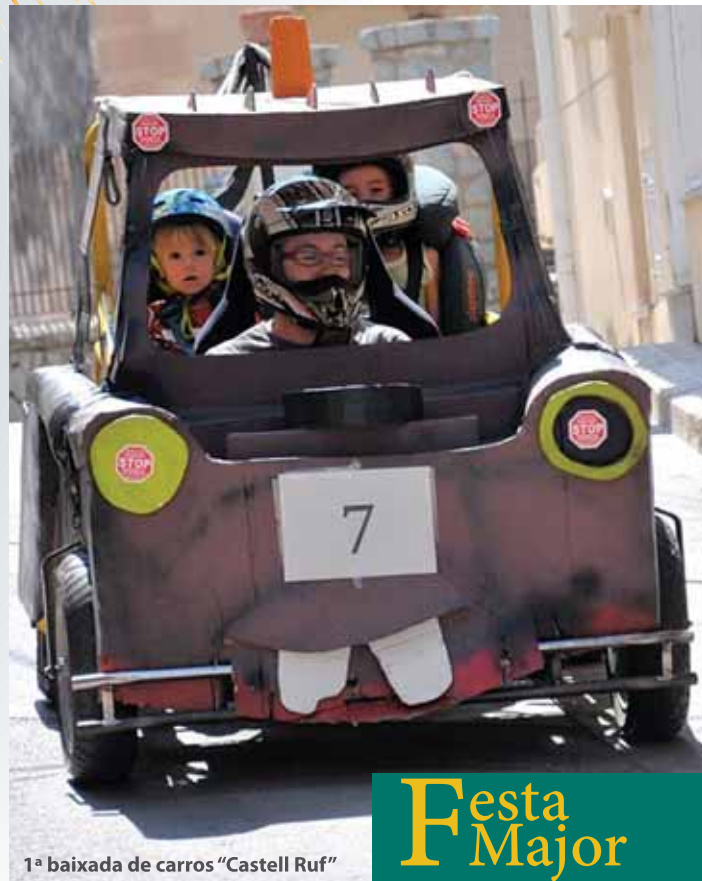
1ª baixada de carros "Castell Ruf"