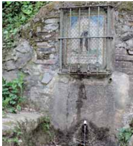
Font del Ca

Des de fa un parell de mesos, la Font del Ca torna a rajar. Ha estat gràcies a les tasques de recuperació de la Brigada Municipal, que amb el seu treball han aconseguit que una font tant emblemàtica com aquesta torni a brollar després de tants anys de no fer-ho. Ara, tots els