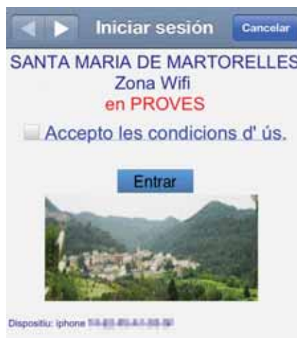
Pantalla de mostra del portal WIFI

Els usuaris dels espais WiFi ubicats al Casal Cultural i a l'Espai Lledoner haureu observat que per connectar-se a Internet ara s'ha de fer mitjançant un portal captiu, i que la velocitat a quedat limitada a 128 kbps. L'objectiu d'aquest portal captiu és que els usuaris acceptin les condicions d'ús, així com limitar el temps de connexió i l'amplada de banda. Hem realitzat