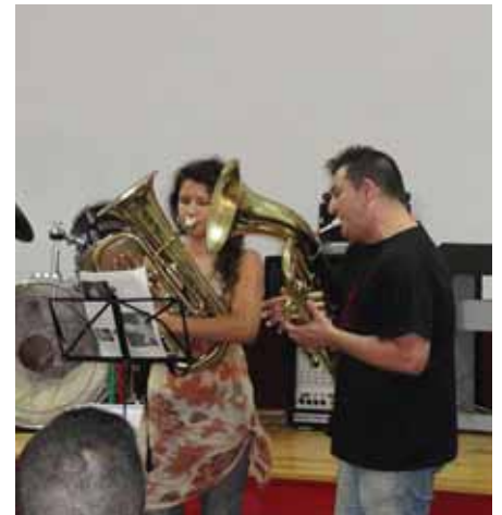
Audició del Taller de música

El passat 22 de juny va tenir lloc l'audició i l'acte de cloenda del curs 2012-2013 al local de la Societat Coral La Flor, on els alumnes van donar bona mostra de l'alt nivell d'aprenentatge del taller. El curs 2013-2014 començarà la segona setmana de setembre i de moment les classes seran els dimecres i divendres a la tarda.