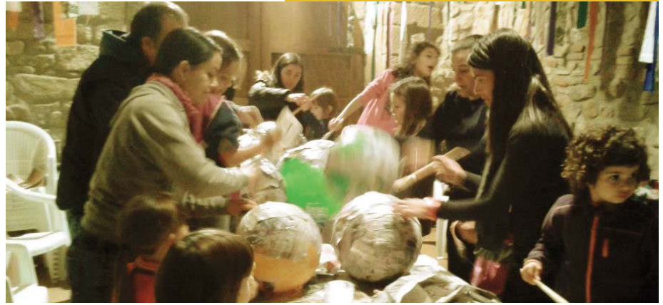
Tallers de Nadal

Les activitats més importants que es realitzen per promocionar l'esport al nostre municipi són la Festa de l'esport, on a l'última edició van participar 144 persones, la cursa de mountain bike i la mitja marató "La neorural", col·laborant