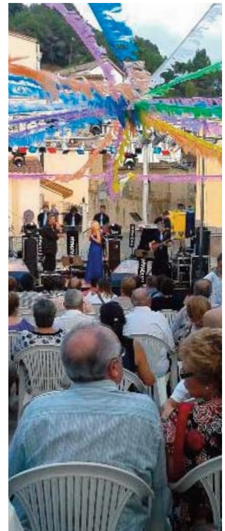
Festa Major 2012

Voldria aprofitar aquest espai per agrair la col·laboració de tots els integrants que conformen la Comissió de Festes, així com de totes les persones que participen, d'una manera o una altra, en la realització de les activitats.